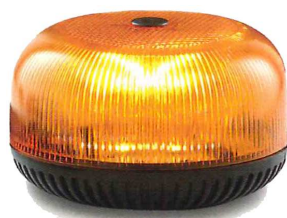
CRYSTAL LED pour Top Case